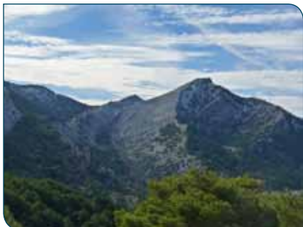
Loma de los Agrios y Aguilón del Loco