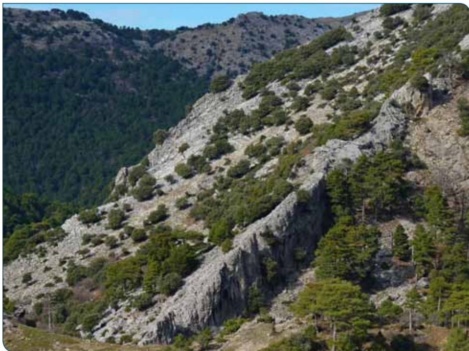
Paisaje del primer tramo de la derivación

Cuentan en la zona que en el siglo XV, cuando Isabel La Católica viajaba hacia la conquista de Granada desde Córdoba, llegó a este punto donde el Guadalquivir estaba tan crecido que no permitía su paso. En una sola noche –según la leyenda– sus caballeros levantaron este robusto puente que le permitió llegar a Baza y Guadix. El inicio de esta derivación se sitúa justo en el puente, debiendo tomar una estre-