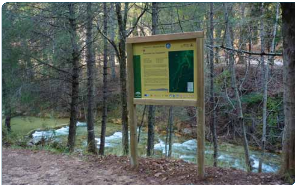
Inicio de la ruta junto al Guadalquivir

Más adelante cruzaremos el Barranco de Navahondona, corazón del Área de Reserva de Navahondona-Guadahornillos, una de las tres zonas de mayor protección de este espacio protegido donde se encuentran muchos de los endemismos botánicos existentes y ecosistemas apenas alterados por el hombre. El punto más alto de este recorrido se encuentra al llegar a la pista forestal a Puerto Llano, a 1600 metros de altitud, muy cerca del Pino de las Tres Cruces y de la cabecera del valle de Gualay, lugar muy conocido y frecuentado por los montañeros que visitan el parque natural.