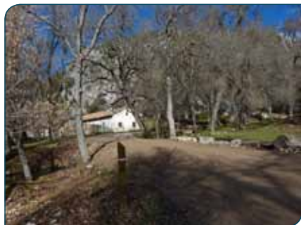
Cañada de las Fuentes

ción de diversas aves (zorzales y mirlos fundamentalmente) para la propagación de sus semillas. Las aves comen sus frutos pegajosos y, después de pasar por su estómago, las semillas quedan depositadas junto a sus excrementos sobre las ramas de nuevos huéspedes, creciendo otra generación de muérdagos que obtendrán directamente la sabia de dichas ramas.