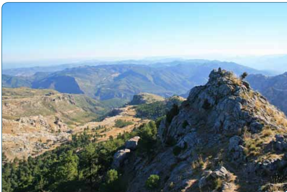
Panorámica infinita desde la cumbre

Yelmo, Peñalta, Navalperal, Buitrera y Peguera. Hacia el oeste destaca en primer plano el Cerro de Santa María, más allá el pueblo de Chiclana de Segura y al fondo la vista se pierde en las interminables llanuras de La Mancha, en la provincia de Ciudad Real, con pueblos como Terrinches, Albaladejo y Villanueva de Los Infantes. Hacia el suroeste tenemos la comarca olivarera de la Loma de Úbeda y las montañas del Parque Natural de Sierra Mágina. Hacia el sur, en la dirección de la larga raspa del caballo , el paisaje es ya más cercano y abrupto, pues vemos en primer plano las montañas de la Sierra de Las Villas en la que nos encontramos, entre las que destaca el pico Pedro Miguel (en ocasiones denominado Blanquillo) con 1830 metros de altitud. Hacia el este continuamos viendo cerca las ásperas y escabrosas elevaciones de Las Villas, con la Sierra de Las Lagunillas y el Almagreros, así como los diversos telones montañosos de la Sierra de Segura al fondo, en los que destacan el Almorchón (1914 metros) y Las Palomas (1964 metros). Más allá aún sobresale la gran mole de La Sagra, en la provincia de Granada, con 2383 metros.