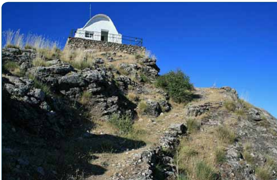
Final de derivación en caseta de fogueros

Llegamos a la caseta de vigilancia forestal, a 1693 m de altitud, que suele estar habitada durante los meses en que existe riesgo de incendio forestal. El puntal es muy aéreo y nos permite recrearnos con larguísimas vistas en todas las direcciones. Al norte vemos diversos montes de la Sierra de Segura, como El