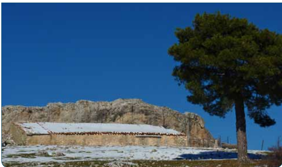
Tinada en Pinar del Risco