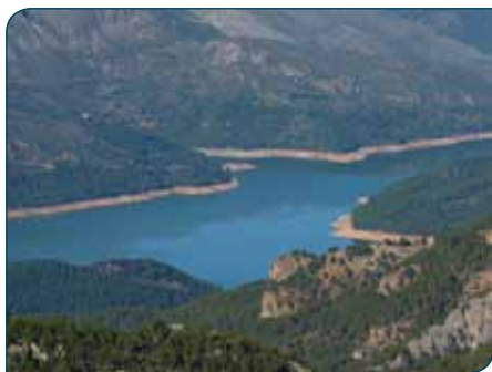
Embalse de El Tranco