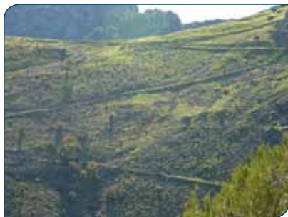
Sendero de subida a La Mocha

La etapa 11 , tal y como se refleja en el poste direccional al final de esta etapa, comienza a las afueras de Cazorla, a los pies del castillo de La Yedra. De cualquier manera el desplazamiento entre ambas localidades es pequeño y forman casi un continuo urbano. Cerca del inicio de la etapa 11 también está el principio de la variante GR 247.3 , según se explica en su correspondiente capítulo de esta topografía.