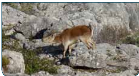
Macho montés joven