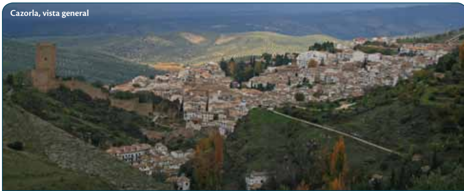
Cazorla, vista general

Son también dignas de ver la Casa Consistorial, que es un magnífico edificio de estilo mudéjar toledano que nos habla del poderío que tuvo la villa en los siglos XVI y XVII, y la iglesia, ya en ruinas, de Santo Domingo de Silos, que denota trazas del inconfundible estilo de Vandelvira. Pero además de estos hitos arquitectónicos, las blancas y empinadas callejuelas de La Iruela tienen un encanto que atraparán al caminante y le invitarán a demorarse paseando por ellas sin prisa para descubrir rincones como la Fuente del Molino o el lavadero municipal.