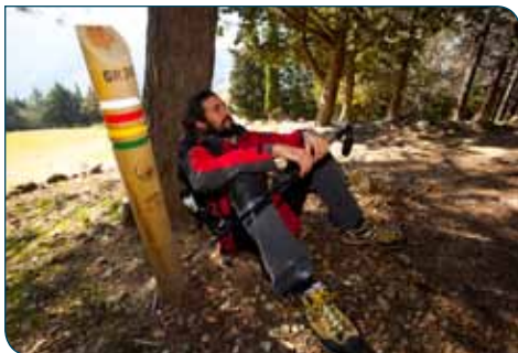
Descanso junto a la ermita Virgen de la Cabeza

bosque de pinos negrales con gran cantidad de boj, especie que será muy abundante hasta el final de la etapa. Hacia el este, en el valle de la cabecera del Guadalquivir, dominan el verde y la frondosidad de los bosques del parque, mientras que hacia el oeste lo hacen el ocre y el verde plateado de los olivos de la campiña.