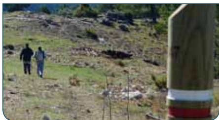
Detalle de la etapa

Continuando nuestra ruta por la cuerda hacia el suroeste, a los 200 metros llegamos a otra nueva puerta de control de restauración forestal. Tras pasarla, el bosque vuelve a estar de pronto presente, un