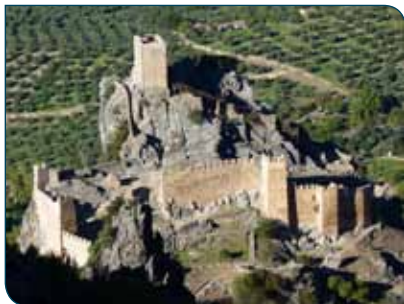
Castillo de La Iruela