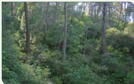
Bosque mediterráneo en Bucentaina

Por tanto, recorriendo los bosques de Acebeas y Bucentaina estaremos dando un paseo por la historia de la evolución vegetal de la Península Ibérica a lo largo de millones de años. Para aprovechar la vocación botánica de esta etapa, no hay que perderse la Colección Botánica de La Peña del Olivar en el final de la ruta, que es un pequeño pero completo jardín donde podemos ver muchas de las especies vegetales más destacadas del parque natural, que lo es, en gran parte, gracias a la extraordinaria diversidad de su flora. Por tanto, recorriendo los bosques de Acebeas y Bucentaina estaremos dando un paseo por la historia de la evolución vegetal de la península ibérica a lo largo de millones de años.