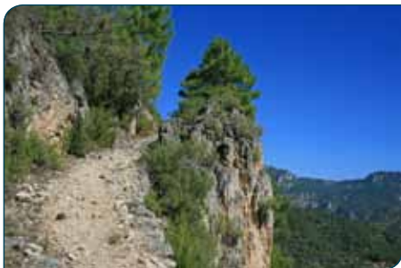
Detalles del sendero en la etapa

En este punto podemos optar por subir a Navalperal, a la izquierda, por el sendero señalado PR-A 176 , que forma parte del sendero Bosques del Sur como derivación 10 y cuya descripción se encuentra en esta misma guía. Es una ruta con unas vistas fantásticas y puede merecer la pena incluirla en nuestra jornada, dado que la etapa 21 tiene una longitud moderada.