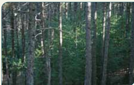
Barranco de Los Acebeas