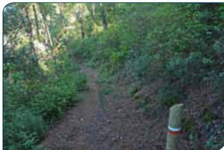
Detalles del sendero en la etapa