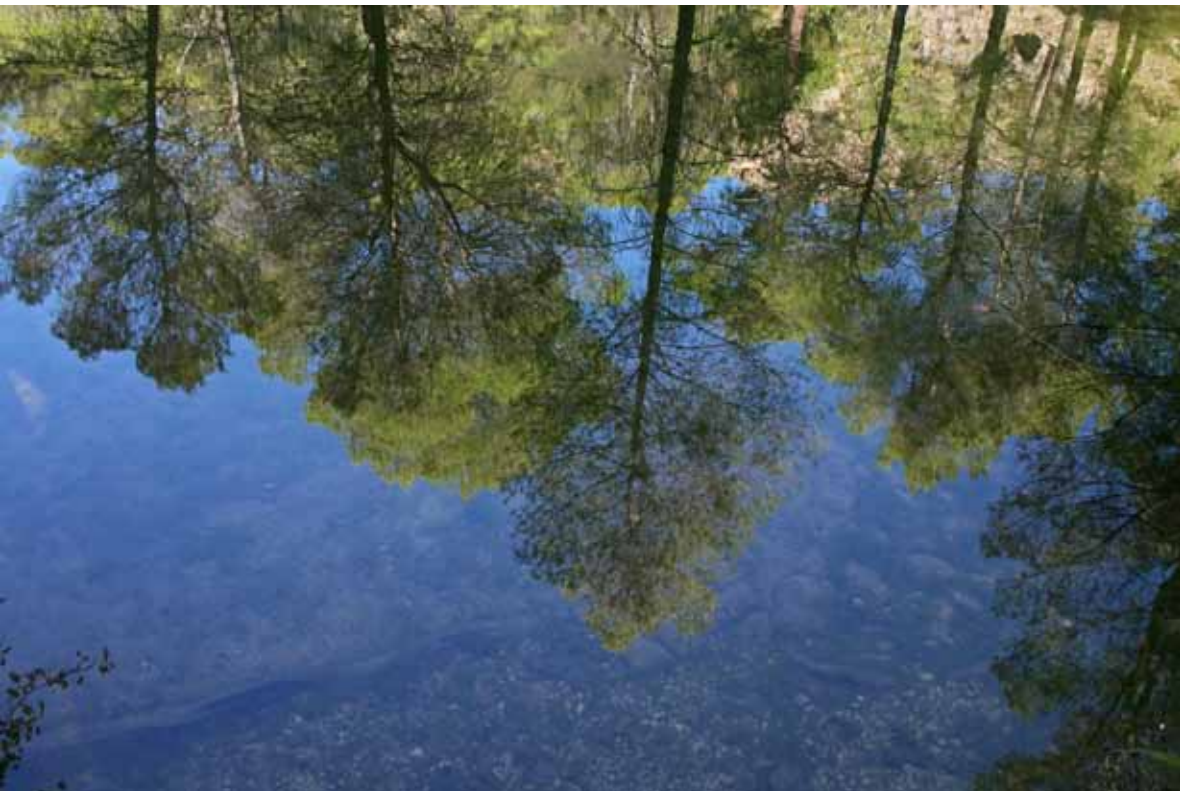
Zona natural de baño en el Área Recreativa Peña del Olivar

Un kilómetro más debajo de la fuente de El Noguerón finalizamos la etapa en el Área Recreativa Peña del Olivar, un lugar muy popular para los vecinos de Siles. Se sitúa a ambos lados del Arroyo de Los Molinos y dispone de fuente, bar, terraza, mesas, parque infantil y, en verano, una magnífica zona natural de baño, de aguas frías y limpias. Hay también un pequeño parque con una colección botánica en la que se pueden ver muchas de las especies más representativas de la flora del parque natural.