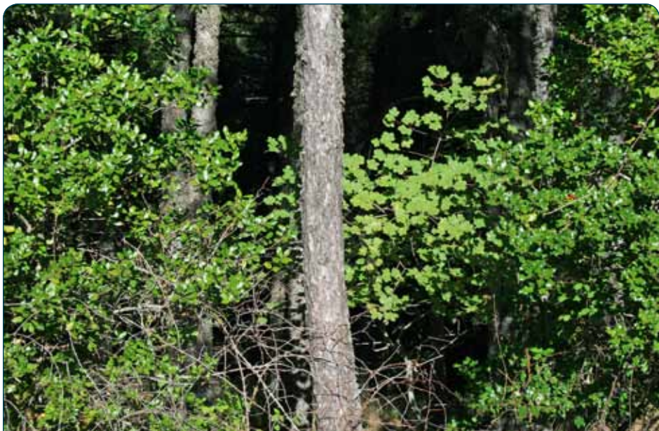
Arce y acebo en Las Acebeas

propia de un bosque del centro o norte de Europa. Es un lugar para detenerse, observar y sentir. Tras pasar el Barranco entra algo más de luz, y por tanto la diversidad de especies es mayor. La limpieza de este corto tramo del sendero Bosques del Sur ha sido somera para respetar al máximo el valor ecológico del entorno, por lo que en el camino hay helechos y ramas de avellanos, acebos, majuelos y rosales que pueden molestar. Hasta llegar a la casa forestal de Las Acebeas, caminamos por un tramo especial donde conviene ir despacio disfrutando con sosiego de todos los detalles de su flora. Pasaremos junto a una pequeña balsa redonda, que era donde se acumulaba el agua para regar la huerta de la familia del guarda forestal, cuando este vivía permanentemente en la casa forestal a la que vamos a llegar enseguida.