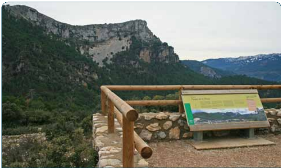
Mirador de Los Poyos de la Mesa

La abundancia de fauna es otro de los grandes atractivos de esta etapa. Ciervos, gamos, muflones, jabalíes y cabras monteses son avistados con facilidad, a veces a corta distancia. No en vano esta fue otra de las zonas favoritas del naturalista Félix Rodríguez de la Fuente para grabar impactantes secuencias de su serie documental El Hombre y la Tierra . Hoy, es precisamente en la Nava de San Pedro