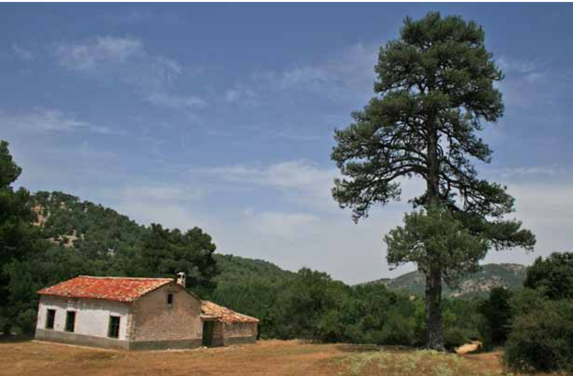
Casa forestal de Fuente Acero

Un mirador con un panel interpretativo nos facilita la contemplación del Estrecho de los Perales, una espectacular garganta flanqueada por irregulares formaciones rocosas. En la zona es frecuente avistar animales tan señeros como la cabra montés y el águila real, lo cual es bien expresivo de su gran riqueza ecológica. De hecho, veremos pequeños carteles a nuestra izquierda que marcan el límite del Área de Reserva de Navahondona-Guadahornillos, una amplia zona donde las actividades humanas están fuertemente restringidas para conservar sus extraordinarios valores naturales.