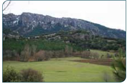
Nava de San Pedro

extiende una vista extraordinariamente armónica y relajante donde se combinan las huertas y tierras de labor, los frutales dispersos, los álamos –amarillos en otoño– y las altas montañas cubiertas de bosques y coronadas por abruptos riscales.