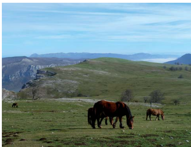
Raso de Legaire. Entzia

1 [KM 2,7] SANTA TEODOSIA. Ascendemos desde San Vicente de Arana saliendo de la pista asfaltada por un camino que se va estrechando entre hayas a medida que el suelo se endurece en quebrados rocosos. Este popular edificio amparado por un imponente fresno, domina el Valle de Arana desde lo alto del puerto de Zanarri, entre las sierras de Iturrieta y Entzia.