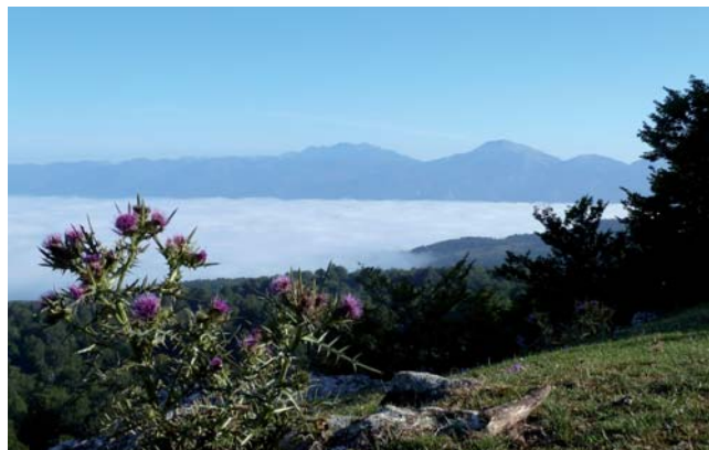
Nieblas sobre la Llanada Alavesa desde los Rasos de Zezama.