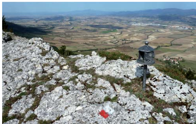
Vistas de la Llanada Alavesa desde Atxuri.