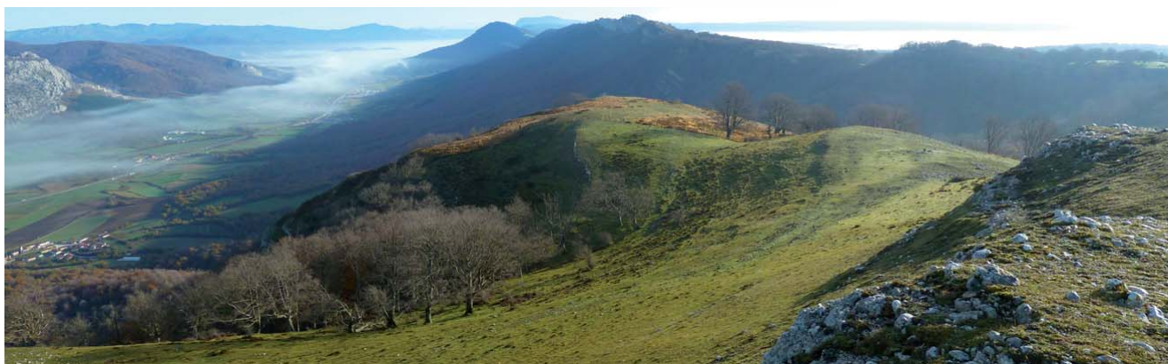
Sierra de Entzia y entrada a Navarra.