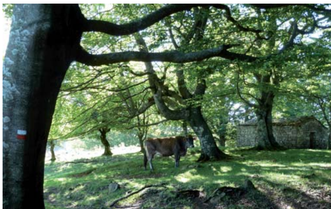
Borda en hayedo. Entzia